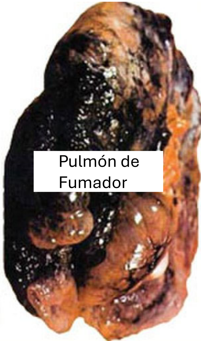
Pulmón de Fumador